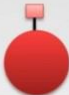
كرية حمراء لشخص ب