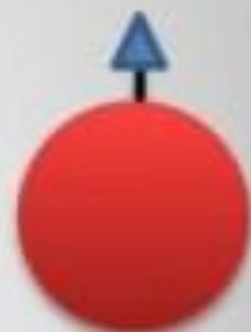
كرية حمراء لشخص أ