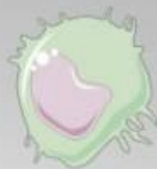
خلية مناعية لشخص أ

تتعرف الخلية المناعية على العنبرين و تعتبرهما اجنبيين و تقوم بتدميرهما.